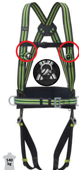
2 POINTS D'ACCROCHAGE + CEINTURE