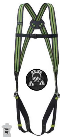
1 POINT D'ACCROCHAGE

Ces harnais disposent d'une ergonomie forte avec des sangles sous-fessières placées pour un confort optimal de l'utilisateur. Les sangles des épaules et des cuisses sont différenciées par deux couleurs distinctes. Les harnais Kratos Safety FA 10 102 00; FA 10 103 00 et FA 10 203 00 sont disponibles en taille unique et sont conformes à la norme EN 361 : 2002. Leurs sangles sont en polyester et leurs boucles en acier. Ces harnais conviendront pour des utilisateurs ne dépassant pas le poids de 140 kg.